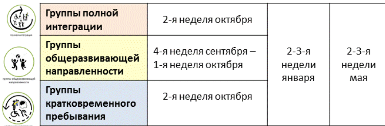
Рисунок 2. График проведения заседаний П-Пк на группах

4.5. Календарный учебный график закрепляет график работы Психолого-педагогического консилиума (см. рис.3)