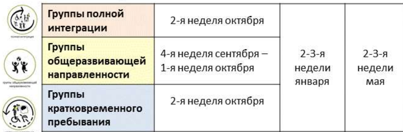
Рисунок 2. График проведения заседаний П-Пк на группах

4.5. Календарный учебный график закрепляет график работы Психолого-педагогического консилиума (см. рис.3)