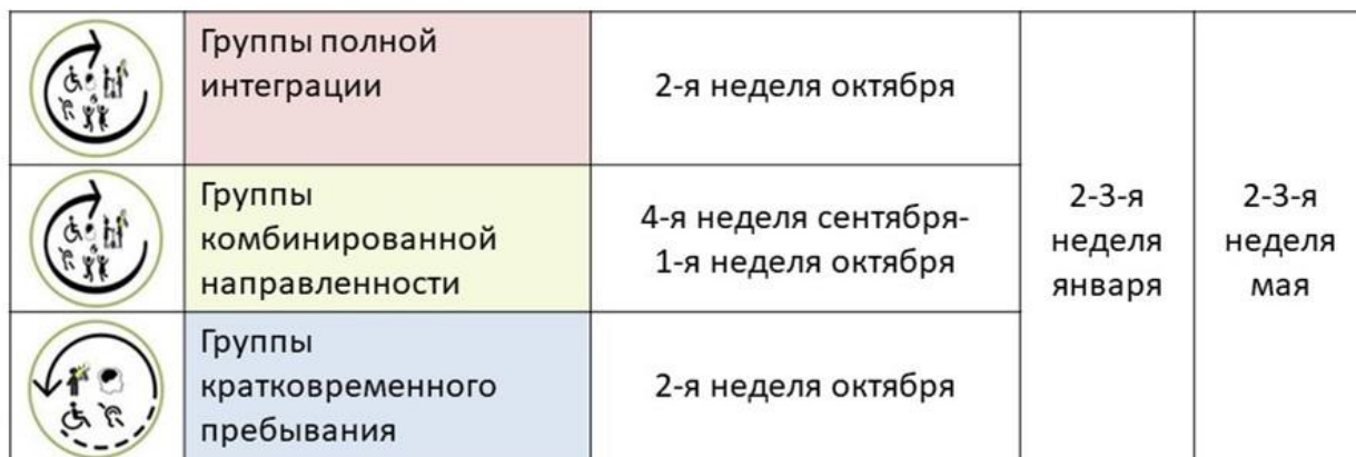
График проведения заседания П-Пк на группах

4.5. Календарный учебный график закрепляет график работы Психолого-педагогического консилиума (см. рис.3)